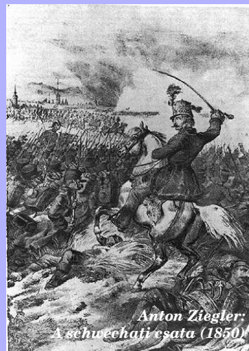
Anton Ziegler: A schwechati csata (1850)